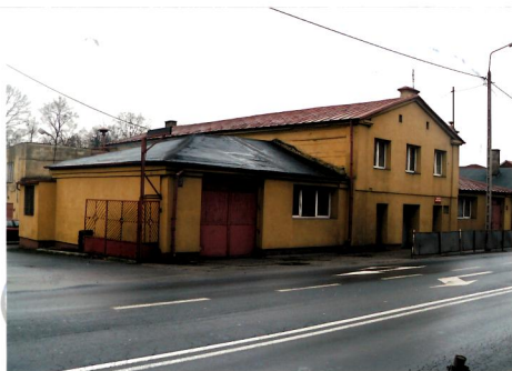
Widok elewacji frontowej od strony północno-zachodniej.

8. Fotografia z opisem wskazującym orientację albo mapa z zaznaczonym stanowiskiem archeologicznym